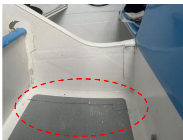
①船内&gt;バルクヘッド部分亀裂