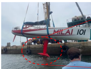
③キールブラケット部の損傷（鉛部分の変形）