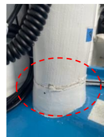
②船内&gt;マストステップ亀裂